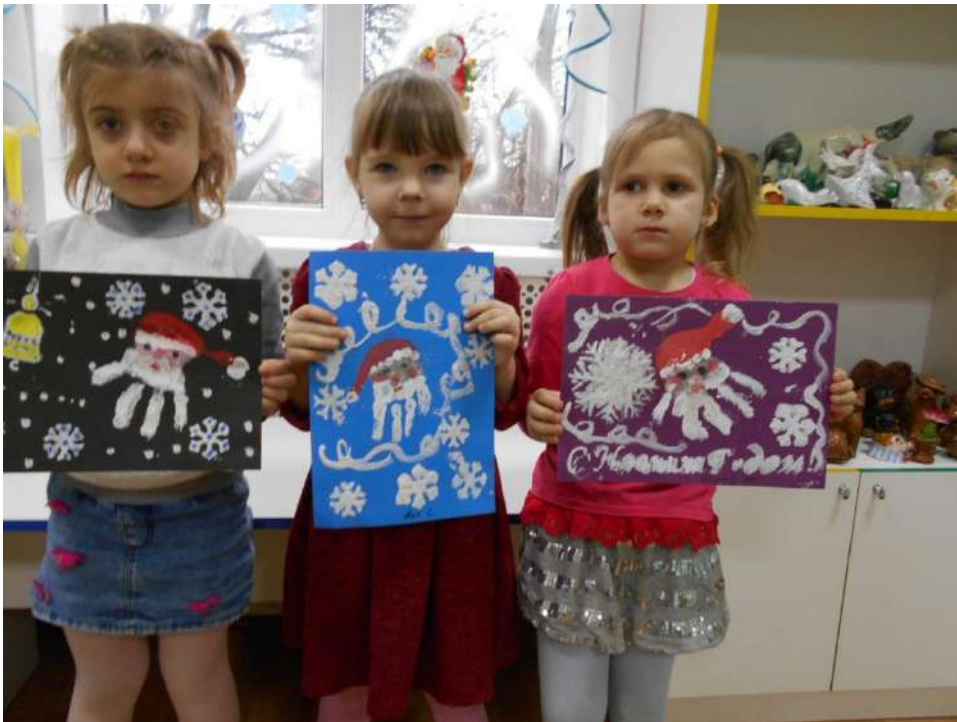
«Дед Мороз» (Рисование ладошкой, солью)