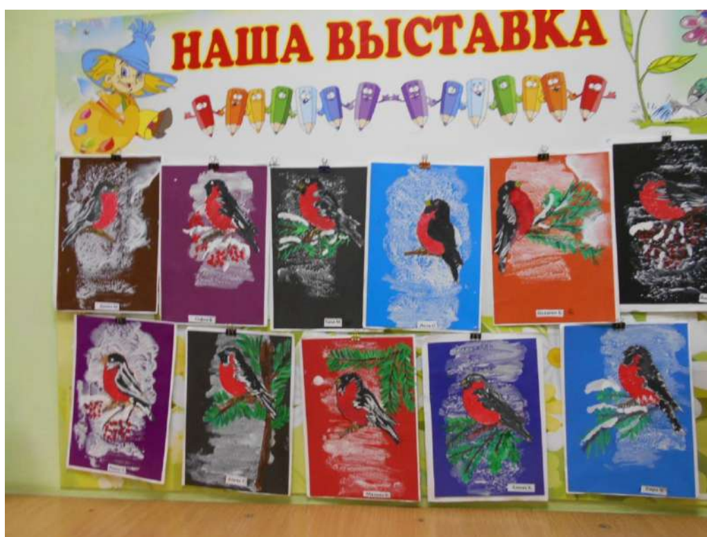
Рисунок "Снегирь" (гуашь) демонстрирует способность замечать и передавать характерные особенности зимующих птиц.