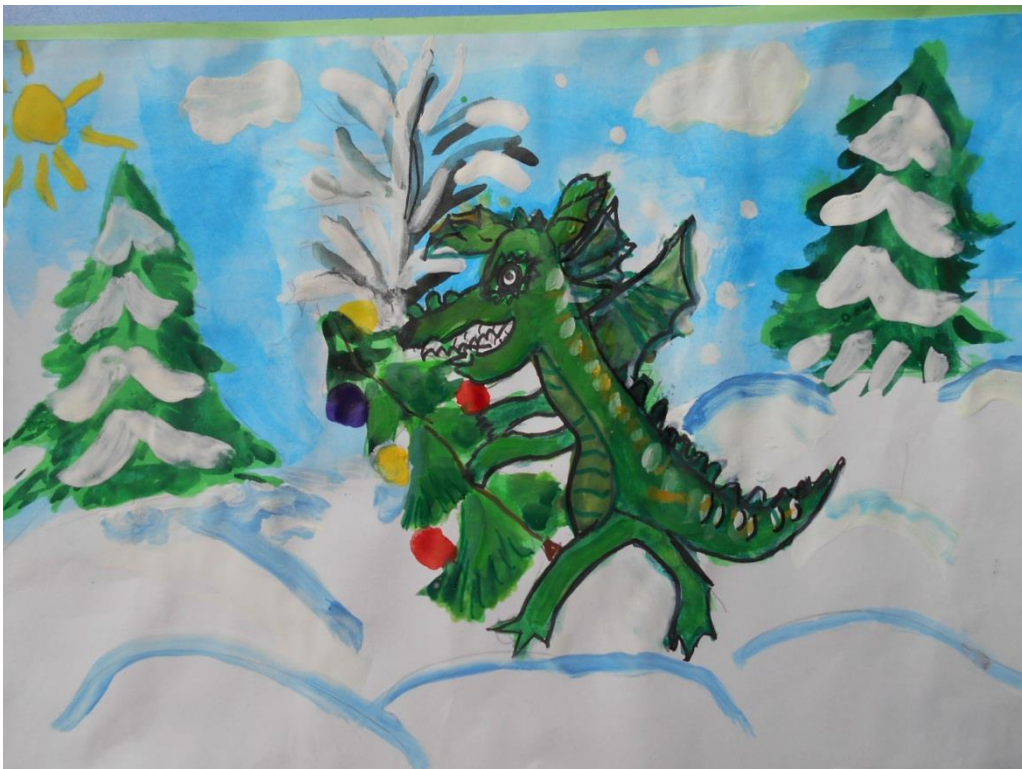
Варвара (6 лет)